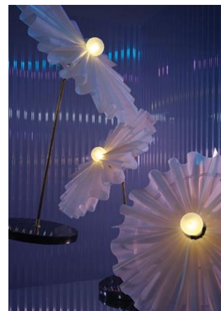
La Ballerina. Design di Elise Luttik e fotografia di Lonneke van der Palen.